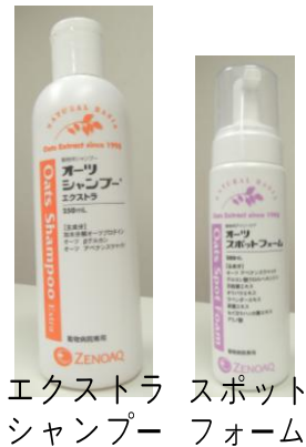
エクストラ シャンプー スポット フォーム

健康なわんちゃんのシャンプーです。被毛に鮮やかな光沢をもたらし、うるおいを保つことを目的としたシャンプーです。皮膚の乾燥を防ぐことで皮膚の痒みをやわらげることがを助けます。