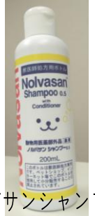
ノルバサンシャンプー

健康なわんちゃんにも使用できる薬用シャンプーです。おもに一般的な皮膚病（軽度膿皮症・マラセチア感染）のわんちゃんに使用します。皮膚病の動物さんでなくても使用できるオールマイティなシャンプーで抗菌効果もありますが、保湿成分も含んでいるのでとても使いやすいシャンプーです。